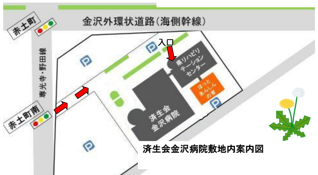
済生会金沢病院敷地内案内図